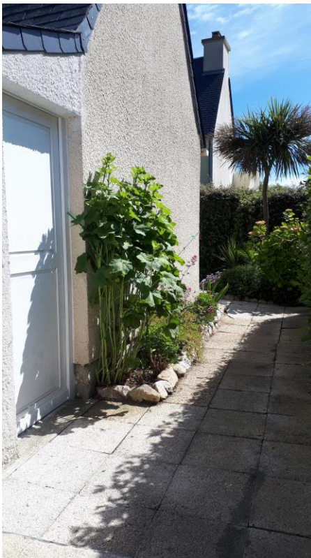
Accès aux vélos et mobilier de jardin / Door to get bicycles and garden furniture