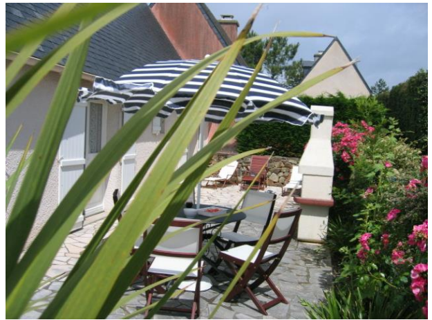
Côté cours/Garden side