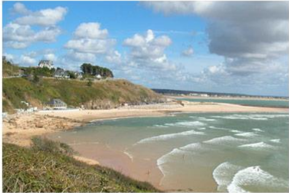
La plage de la potinière/ Potinière beach 500m